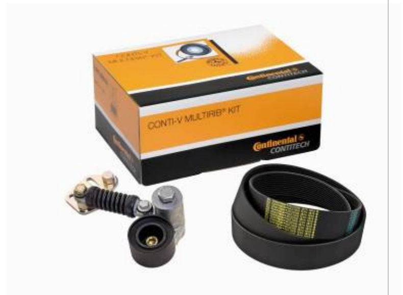
ZESTAW do pompy wody

Redakcja: ContiTech Antriebssysteme GmbH Marketing Service · Silvia Schaffeld Philipsbornstraße 1 · D-30165 Hannover Tel: ++49(0)511 938-5203 · Fax: ++49(0)511 938-5065 silvia.schaffeld@ptg.contitech.de · www.contitech.de